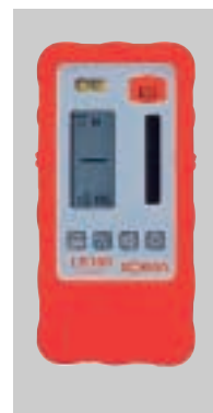
プロテクタLRP1装着時