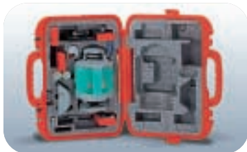
便利なオールインワン格納ケース

本体・標準付属品一式に加えて、複数の受光器やロッドクランプ、スベアバッテリー等をまとめて収納できます。